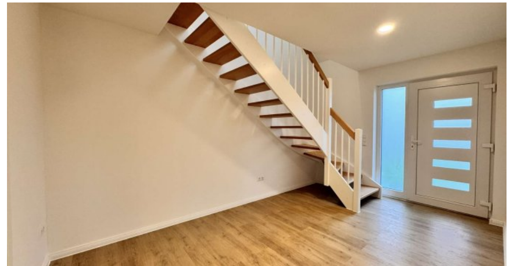
Treppe zum DG