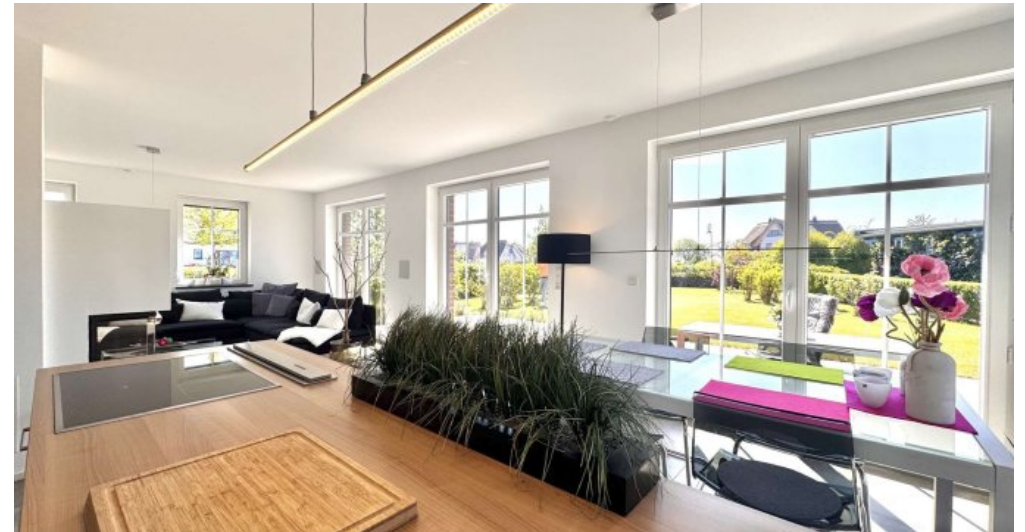
Küche + Esstisch